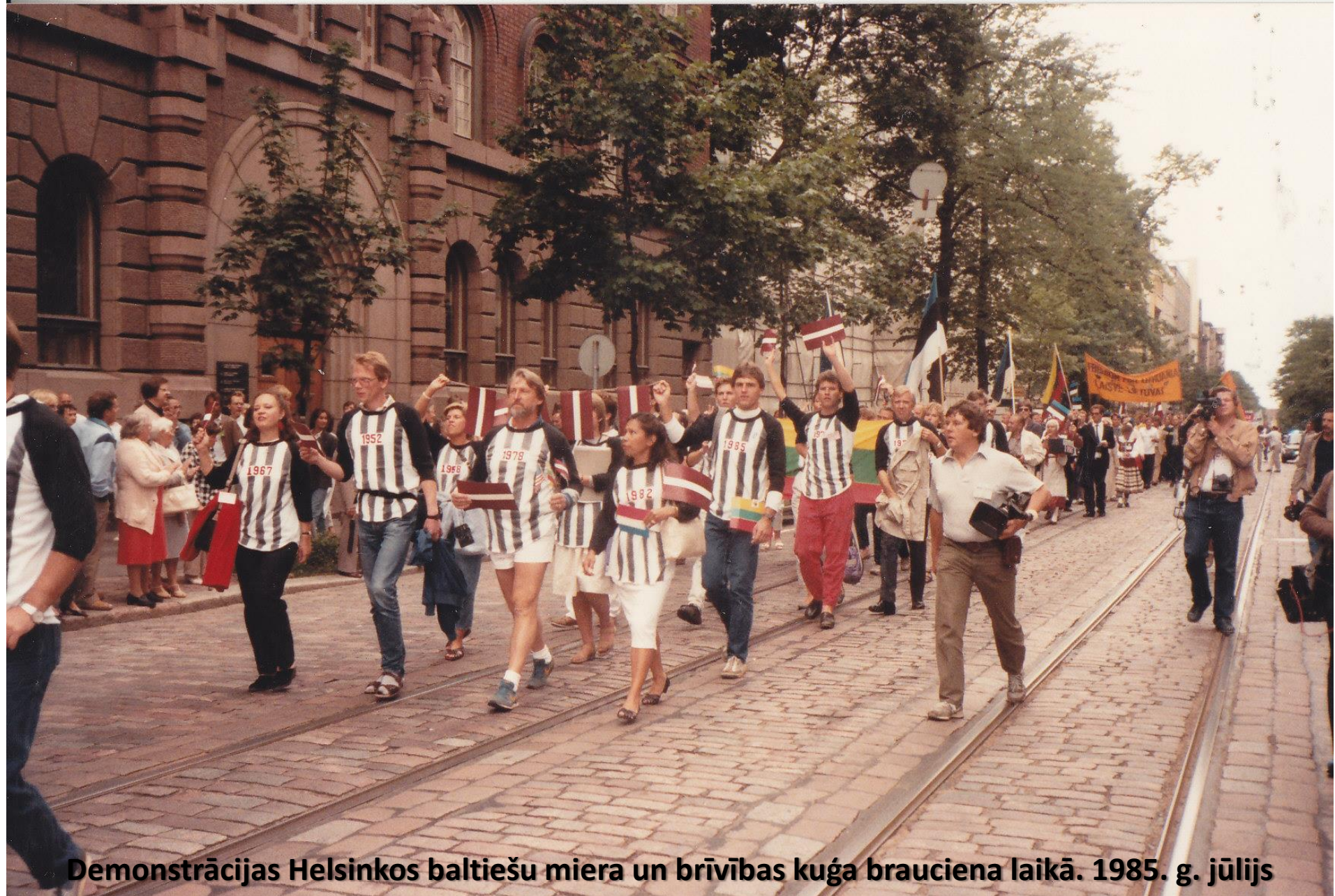
Demonstrācijas Helsinkos baltiešu miera un brīvības kuģa brauciena laikā. 1985. g. jūlijs