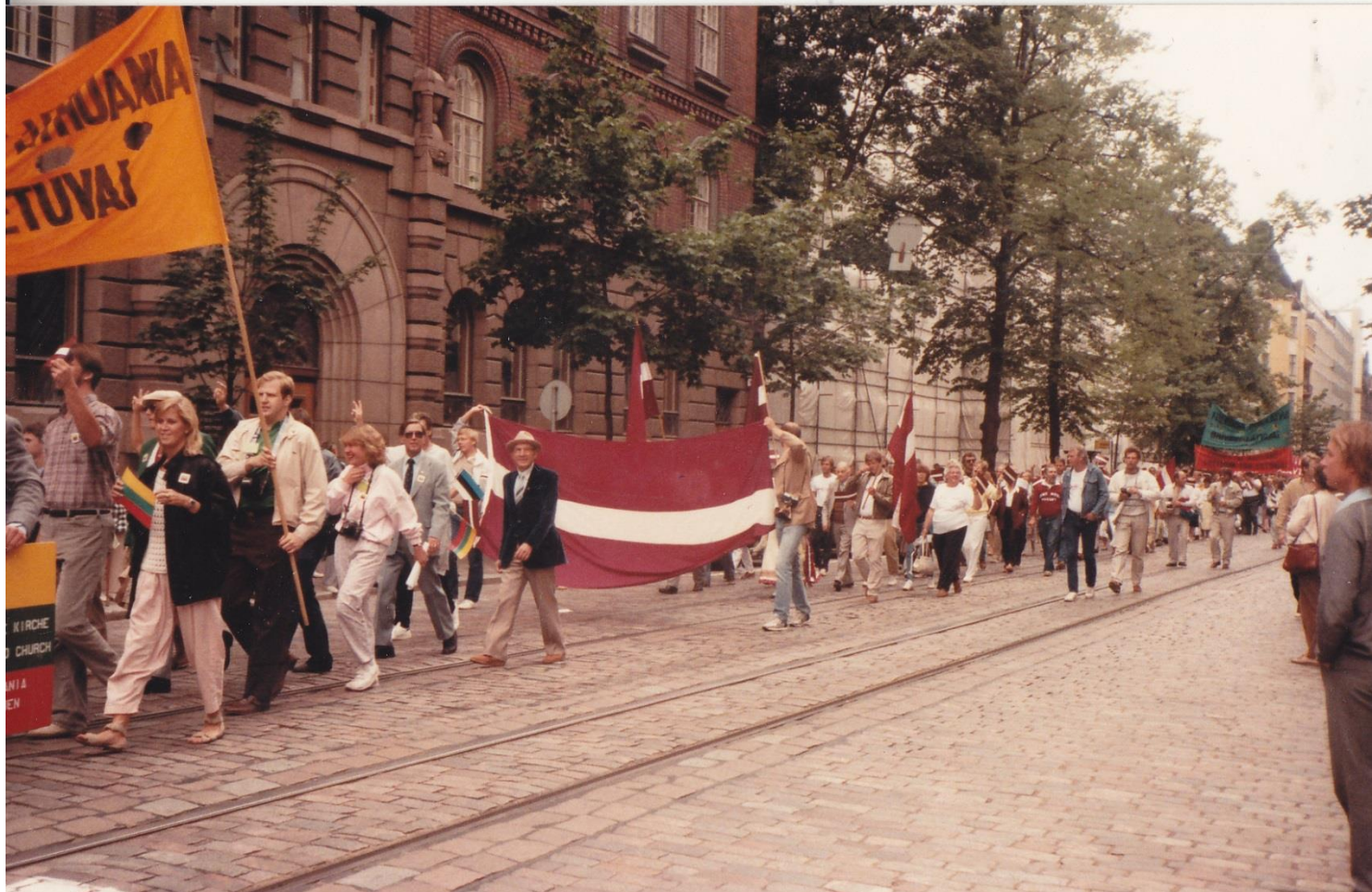
Demonstrācijas Helsinkos baltiešu miera un brīvības kuģa brauciena laikā. 1985. g. jūlijs