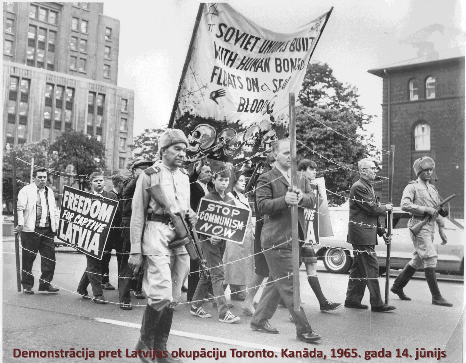
Demonstrācija pret Latvijas okupāciju Toronto. Kanāda, 1965. gada 14. jūnijs