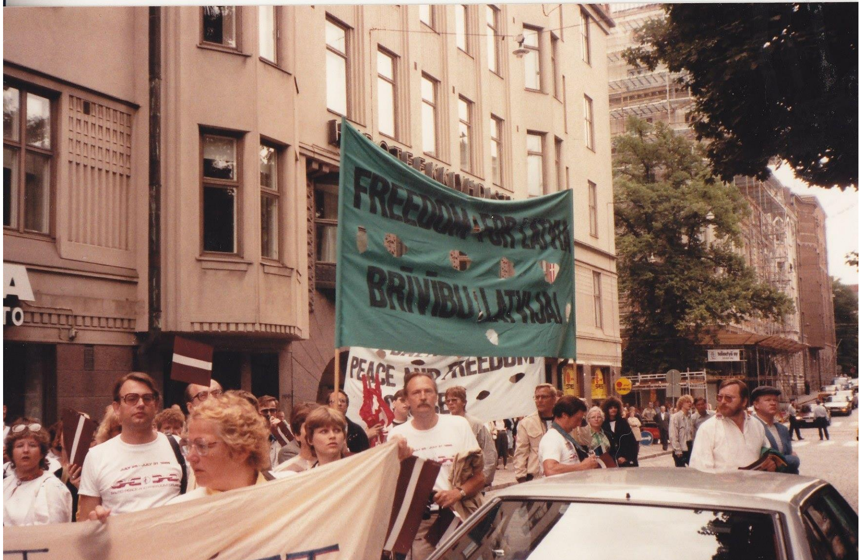
Demonstrācijas Helsinkos baltiešu miera un brīvības kuģa brauciena laikā. 1985. g. jūlijs