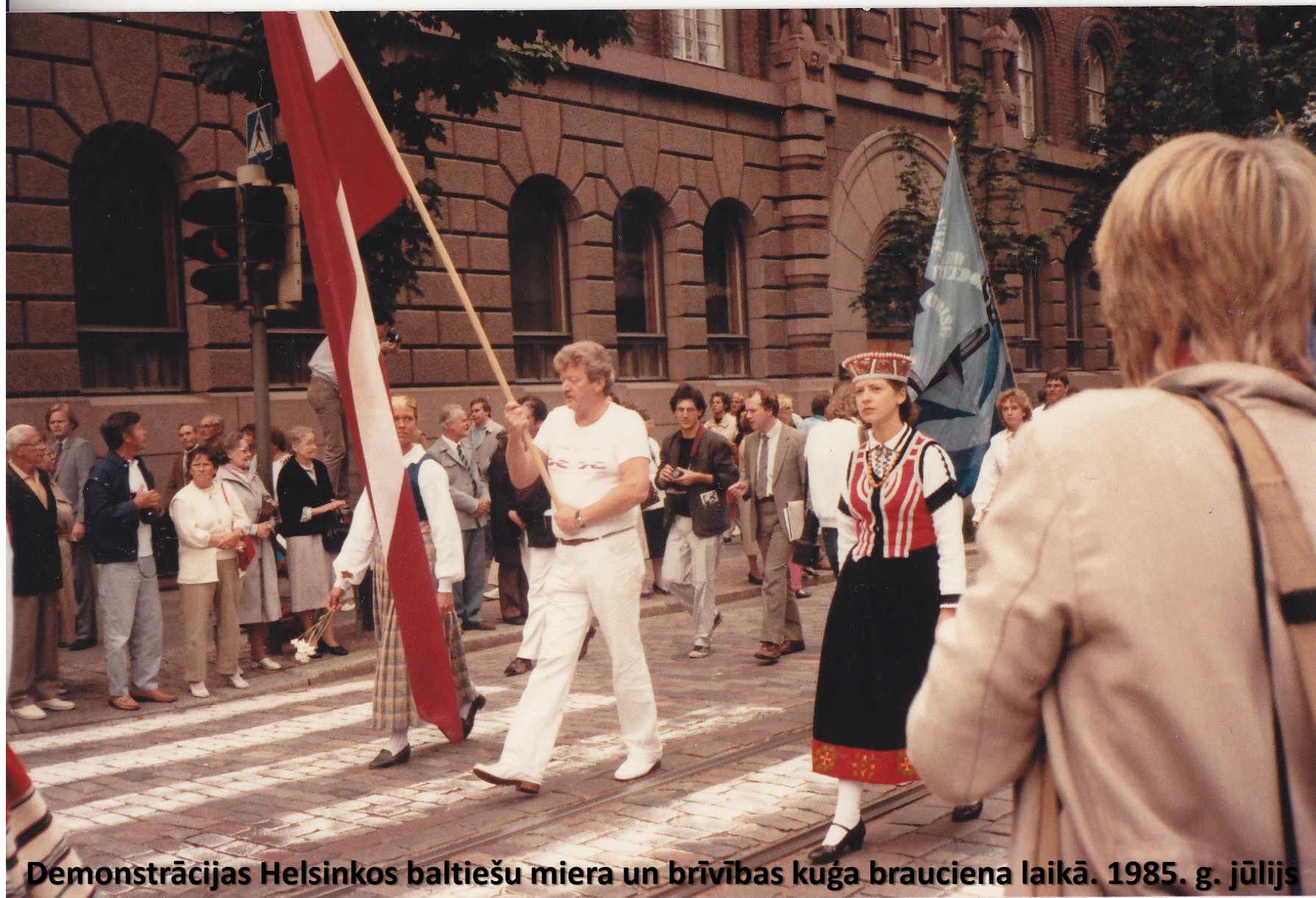
Demonstrācijas Helsinkos baltiešu miera un brīvības kuģa brauciena laikā. 1985. g. jūlijs